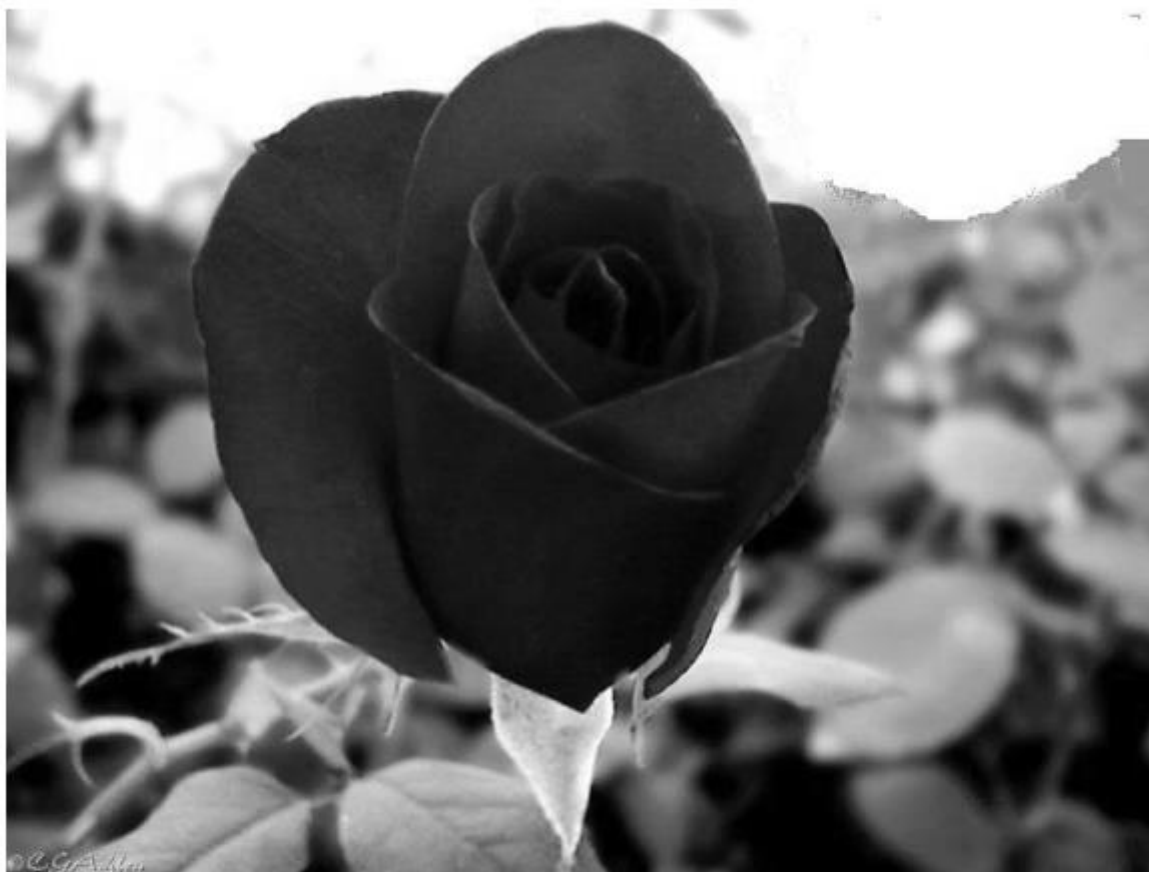
Figura 1 – Flora Brasileira. Rosa (pertence à família Rosácea ).

Obs.: Os dizeres que a acompanham nunca podem ultrapassar o seu tamanho.